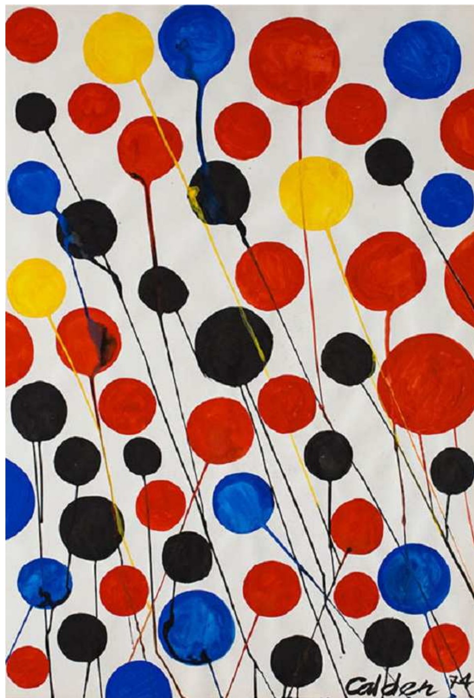
Sin título, 1974. Gouache y tinta sobre papel, 110 x 75 cm. © 2019 Calder Foundation, New York / VEGAP, Madrid.